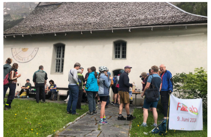
Regio-Gottesdienst «Faar ab» am 9. Juni 2024 in Gadmern

Das Ziel besteht in einer engeren Zusammenarbeit der Kirchgemeinden im Hasli, nicht in einer Fusion. Wir sehen diesen Prozess als Chance. Der Austausch und das Teilen von Ressourcen soll für alle Beteiligten Gemeinden einen Mehrwert ermöglichen und die Freude am vielfältigen kirchlichen Leben in unserem Tal erhalten.