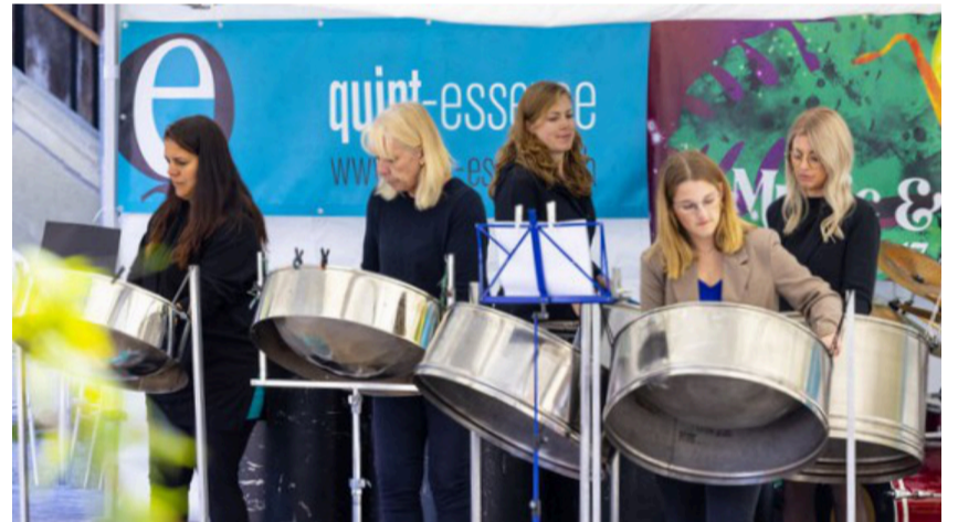
Steel-Band «quint-essence»

Anschliessend an den Gottesdienst sind alle zum Apéro in die Pfrundschiir eingeladen.